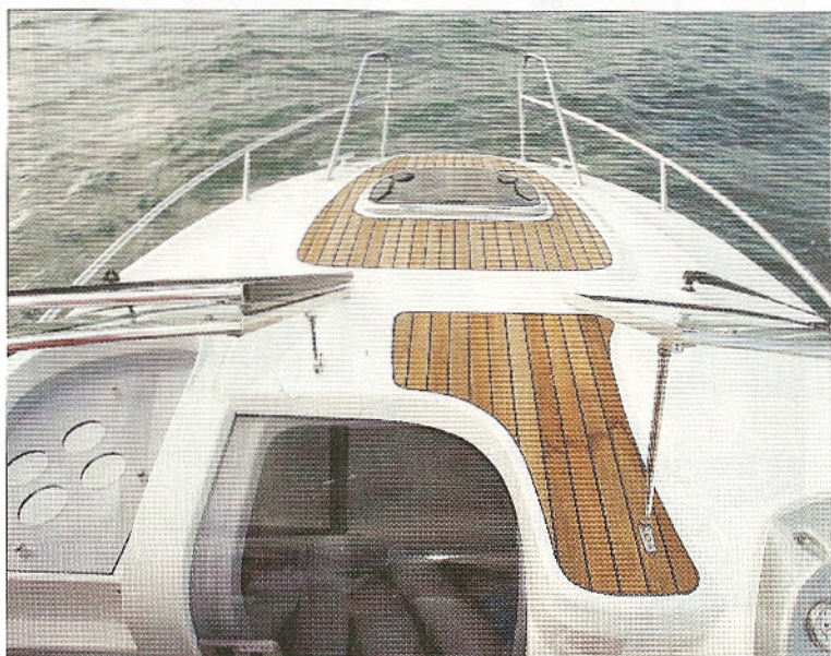
Pour rappeler l'esprit nordique, le passage central ainsi que le pont avant sont recouverts en série de bois massif naturel.