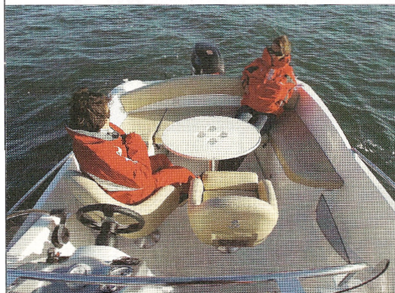
En ajoutant une table et en retournant les deux sièges du poste de pilotage, le cockpit se transforme en un salon de pont.

de l'électronique. Le siège pilote est réglable d'avant en arrière, pivotant, et l'extrémité de son assise est relevable, ce qui assure une excellente position de conduite, qu'elle soit debout ou assise. Propulsé par un moteur Suzuki de 150 chevaux, le 650 Sundeck déjauge en quelques secondes avec un cabrage quasi imperceptible. Son pilotage est très agréable et son passage dans le clapot confortable. Quant à son comportement, il reste sain quels que soient le réglage du trim et le type de virage.