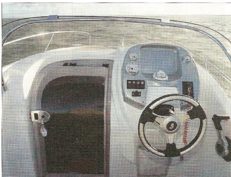
Comme sur tous les Flyer, le tableau de bord est doté d'une pièce en ABS gris métal prévue pour recevoir de l'électronique.