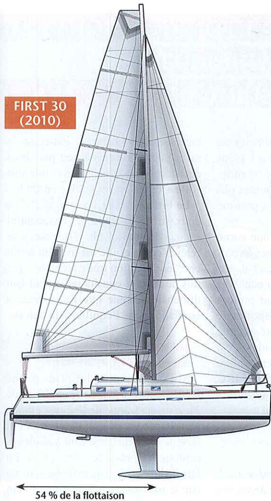
FIRST 30 (2010)