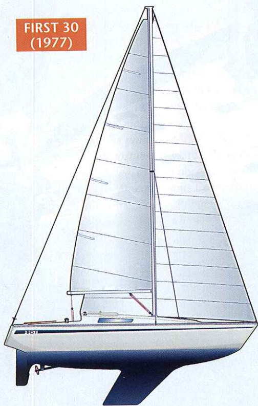
59 % de la flottaison (position du mât par rapport à l'arrière)