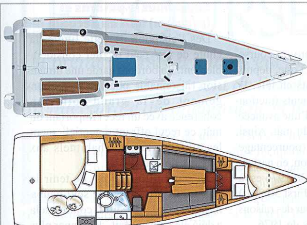
FIRST 30 (2010)