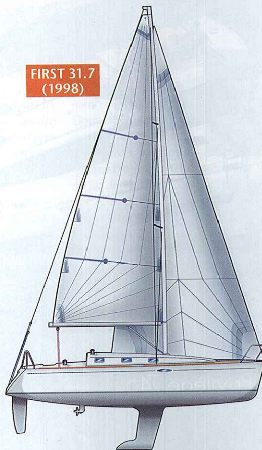
62 % de la flottaison